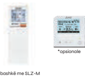
*bashkë me SLZ-M